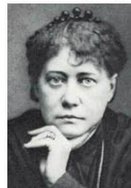
Helena Petrovna Blavatska

Helene Petrovne Blavatske. Ta je nekaj let živela in delala s skupino mojstrov v Himalaji. Eden od njih je bil mojster Morya, njen mojster, drugi pa mojster Koot Hoomi. Oba sta zelo visoko razvita mojstra. Ta dva mojstra sta globoko vpletena v delo s človeštvom in bosta z mojstrom Jezusom uvedla novo svetovno religijo, ki se bo kasneje razvila. To bo zelo znanstvena religija, ki bo temeljila na procesu posvečenj, o katerih smo govorili.