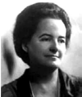
Alice A. Bailey

živijo v odmaknjenih področjih gora in puščav. Od časa do časa človeštvu razkrijejo določene vidike svojega nauka v meri, kot ga lahko vsrkamo in uporabljamo – da bi nas razsvetlili.