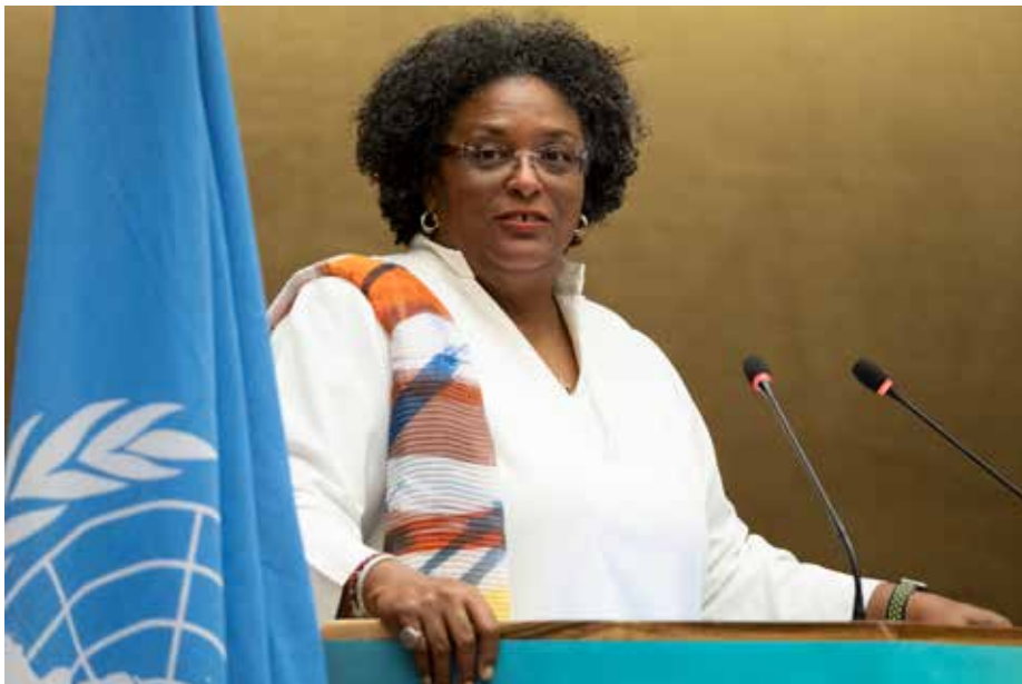
Barbadoška premierka Mia Mottley

Ko nam primanjkuje resnice in zupanja, pravo postane teater. Novice