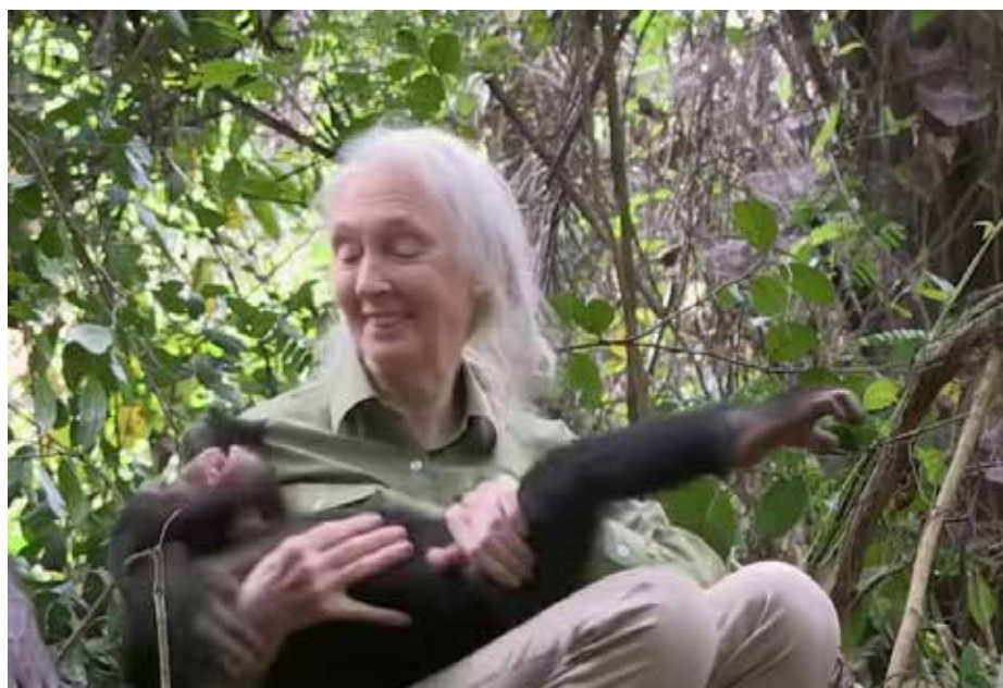
Jane Goodall s »smejočim« šimpanzom

* Share International , januar-februar 2022