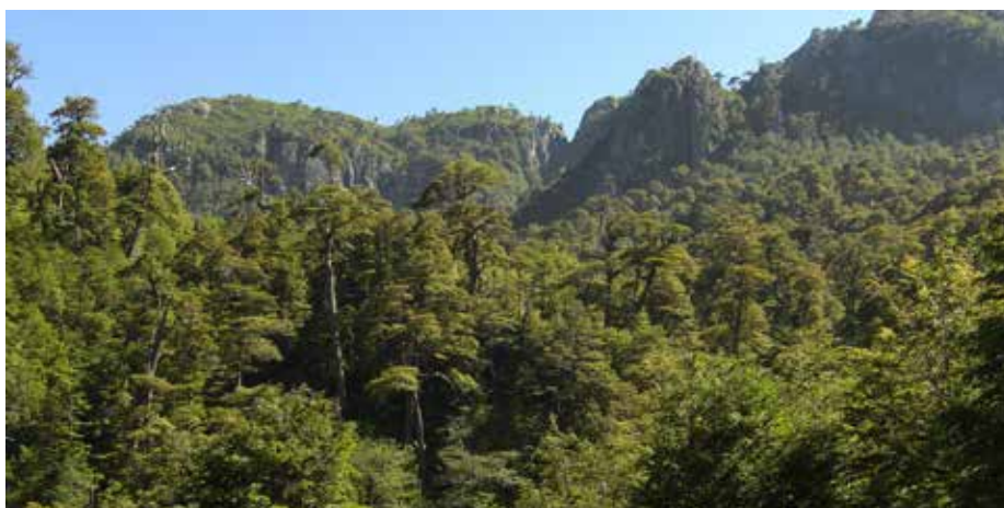
Čile je podprl 861 projektov, ki jih vodijo skupnosti in so od leta 2020 obnovile več kot 14.000 hektarjev avtohtonega gozda.