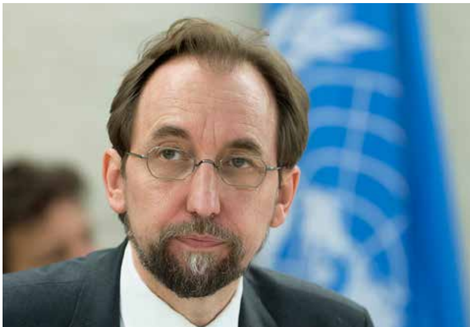
Zeid Ra'ad Al Hussein, nekdanji visoki komisar ZN za človekove pravice.

ozonskega plašča. Mednarodno sodelovanje je nedvomno močno orodje. Nobeni državi ne bi koristil njegov propad.