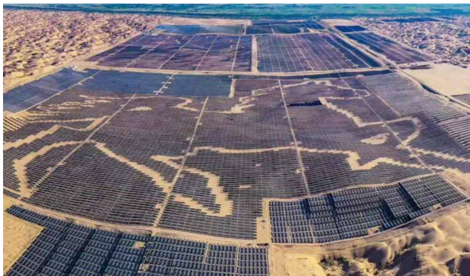
Na Kitajskem se je zmogljivost vetrne in sončne energije od leta 2021 potrojila.