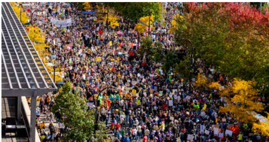
Več tisoč zbranih na protestu No kings (Nobenih kraljev) v Minneapolisu v ZDA