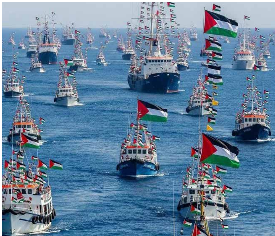
Globalna flotilja Sumud na poti v Gazo, ki je želela odpreti humanitarni koridor in dostaviti pomoč na ozemlje, ki trpi katastrofalno lakoto. Slika generirana z Ul.